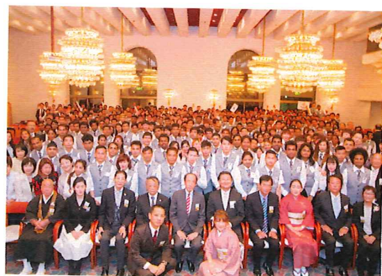
OMO前橋校・高山校 合同入学式2018年度