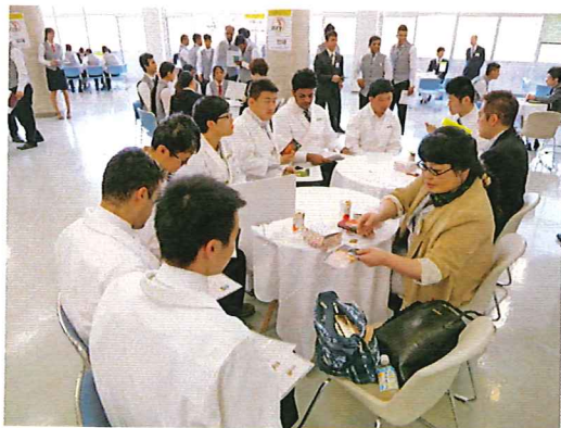
4月開催の第1回おもナビ(高山フェア)

●相談ブースに設置する看板をこちらで作成も致します..... ●出展企業卓上プレート(A4横サイズ)・ネームプレート/無料 ●看板作成料(W1220*H268.9+足付き)/6,000円 ●会場(コーナー)で食べられる..サンドイッチ/1,000円(ドリンク付)