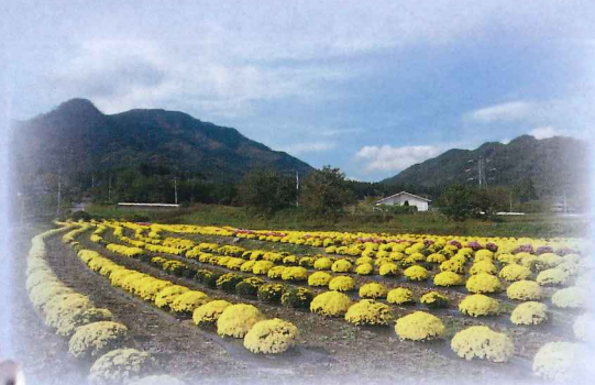
秋の見頃：一之宮の菊畑 10月下旬～11月上旬