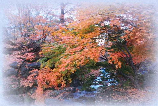
泰寧寺の紅葉 11月上旬～中旬