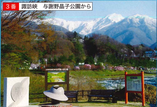
与謝野晶子の歌碑が立ち並ぶ公園から利根川・親水公園・谷川連峰を一度に眺望できるスポットです。