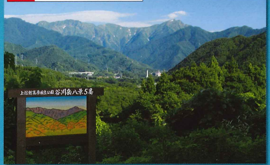
上牧駅周辺の高台からの眺めは最高です。