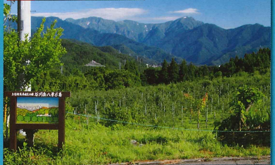
天神平、谷川岳、阿能川岳の連なりがりんご園越しに一望できます。