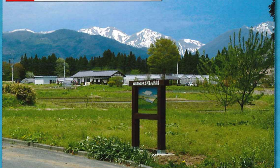
谷川連峰の西端に位置するエビス大黒の頭と仙ノ倉山を背景に田園風景を一望できます。