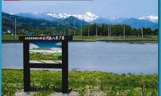
広々とした田園と谷川連峰、のどかな風景です。雪解けの頃には岩肌親子馬の姿が現れます。