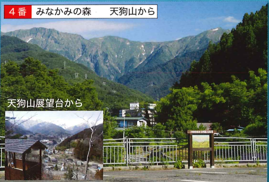
天狗山展望台から