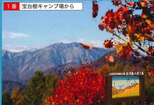
谷川連峰の東面を一望できます。この景色が見られるスポットは希少です。(冬期閉鎖)