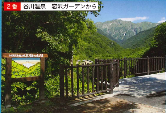
谷川岳南面の俎罫(まないたぐら)が目の前に迫ってきます。写生にも絶好のポイントです。