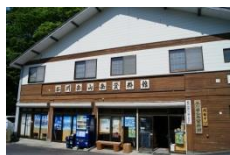
谷川岳山岳資料館