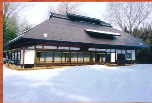
りゅうこうあんがいかん 龍光庵外観