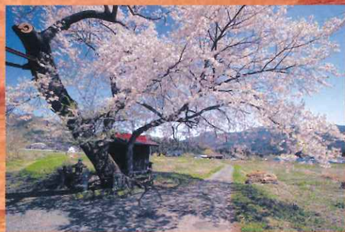
いちのみやさくら 一之宮桜

WOULD YOU LIKE TO ENJOY THE TEACEREMONY WITH US ?